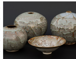
Atelier du Roc d'Arguille

Informations et autres idées de visites sur www.chartreuse-tourisme.com/rsf ou sur la carte de la Route des Savoir-Faire et des Sites Culturels (disponible gratuitement dans les offices de tourisme du massif).