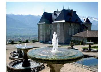
Jardins et château du Touvet