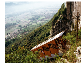
Funiculaire de St Hilaire du Touvet