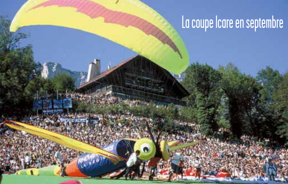
La coupe Icare en septembre